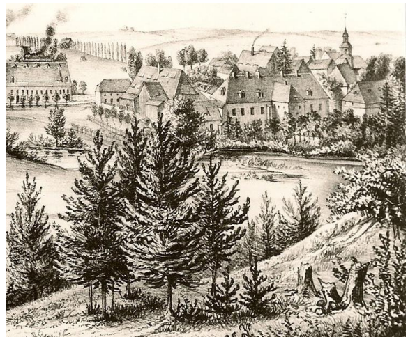
Rittergut um 1860

Die Rittergutsbesitzer wechselten häufig. Vermutlich ist dies auf die mageren Böden zurückzuführen, welche den Besitzern nie die Reichtümer bescherten, die sie erwarteten. Die Besitzer waren meist Angestellte des Dresdner Hofes, die Medingen oft als Landsitz nutzten. Leider existieren von den Medinger Rittergutsbesitzern kaum Bilder oder Porträts. Nachfolgende Namen tauchen in alten Urkunden im Zusammenhang mit dem Rittergut auf und lassen auf die jeweiligen Grundherren schließen. Als nächste Besitzer des Medinger Rittergutes folgten: