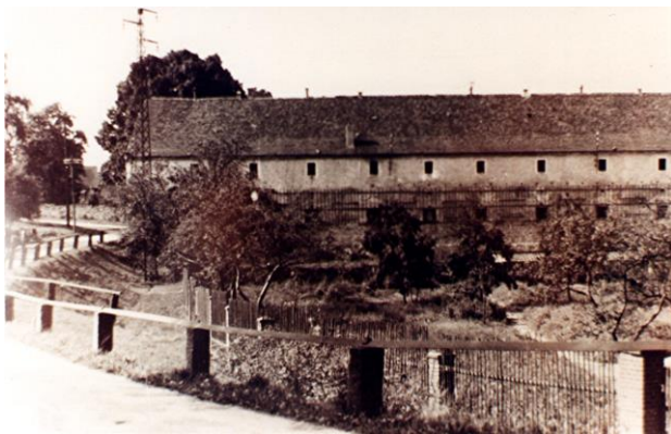
ehemaliger Kuhstall um 1930

Der Rittergutshof war bis um 1930 baulich gesehen ein großer Dreiseithof. Auf die einzelnen Gebäude wird im Einzelnen eingegangen.