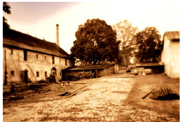
Rittergutshof um 1930